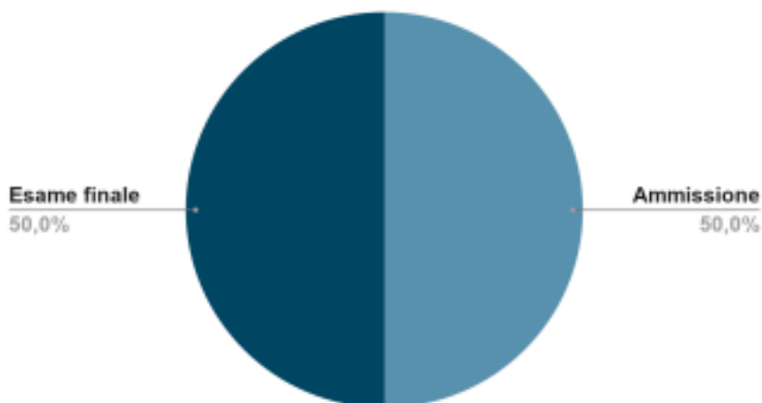
Valutazione conclusiva del primo ciclo d'istruzione

La valutazione dell'esame di Stato è il frutto della media aritmetica ponderata delle valutazioni in decimi ottenute dall'allievo nella discussione dell'elaborato, la cui tematica è assegnata dal Consiglio di Classe, e nel colloquio orale che punterà ad accertare il livello di padronanza degli obiettivi e dei traguardi di competenza logico - matematiche, della lingua italiana e delle lingue straniere; secondo la seguente incidenza: